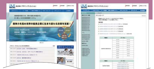
ダウンロードトップページ

また、Eメールによるお問い合わせや、各種申請書のダウンロードも可能です。メンテナンスファイルは、定期的にホームページにアップされ、ダウンロードが可能です。